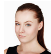
Lucie Eisenreichová, zpěvačka, moderátorka

Univerzita Hradec Králové nám dává příležitost vzdělávat se, i když už nechceme studovat každý den. Dále možnost chodit na zajímavé přednášky a tím rozvíjet svůj všeobecný rozhled. Má skvělé zázemí nejen pro studenty. Univerzita rovněž provozuje Univerzitu třetího věku, kam senioři docházejí jednou týdně.