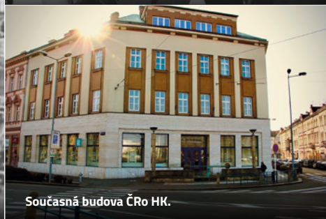
Současná budova ČRo HK.