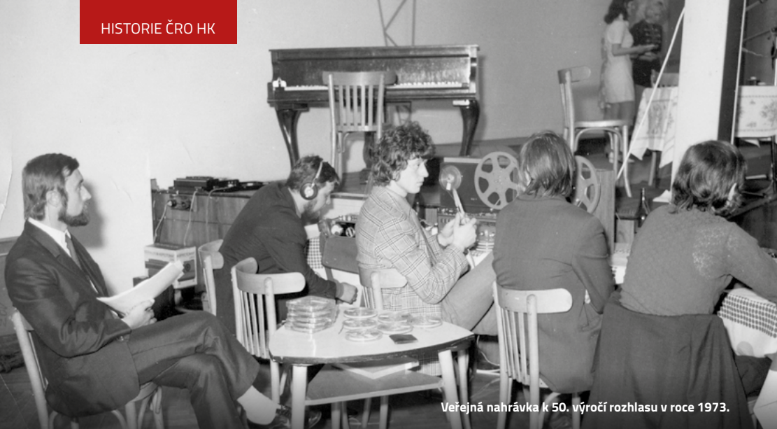
Veřejná nahrávka k 50. výročí rozhlasu v roce 1973.