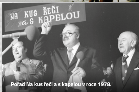
Pořad Na kus řeči a s kapelou v roce 1978.