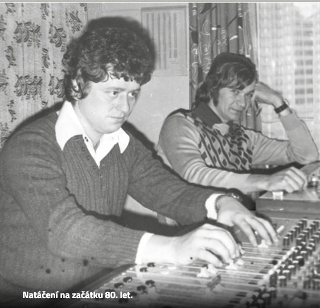
Natáčení na začátku 80. let.