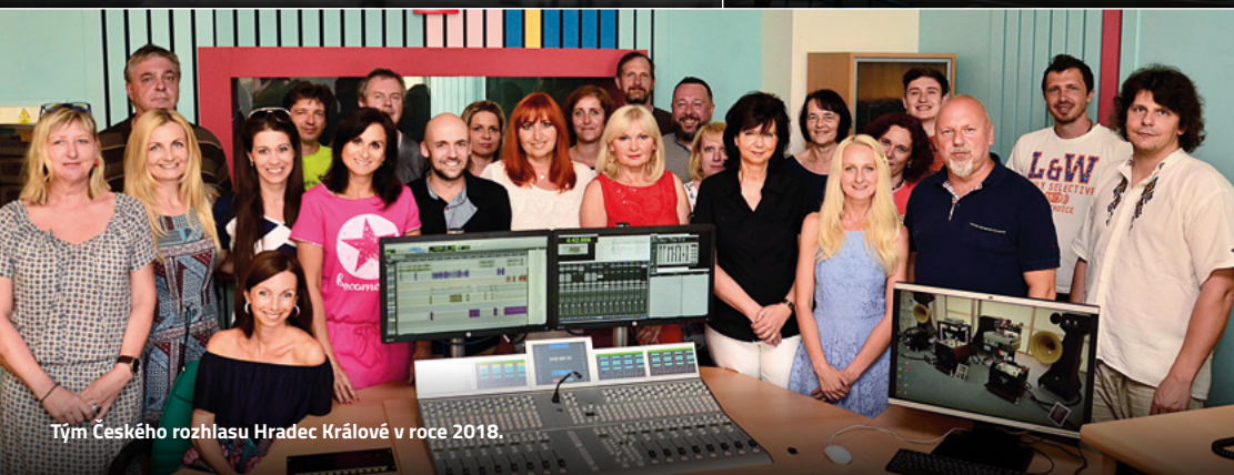
Tým Českého rozhlasu Hradec Králové v roce 2018.