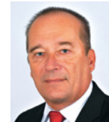
Alexandr Hrabálek, primátor Hradce Králové

Rekonstrukce Velkého náměstí je jednou z dlouhodobých priorit vedení města, která nezůstává jen na papíře, ale začínáme ji realizovat. Úvodní etapou jsou rekonstrukce podloubí domů po obvodu náměstí, která město plánuje na vlastní náklady opravit. Oslovili jsme vlastníky nemovitostí s prosbou o vyjádření součinnosti v této věci. Je to začátek přeměny srdce Hradce, do kterého by se měl v následujících letech vrátit jeho původní život. Hlavním smyslem je vytvořit pro veřejnost krásné prostředí, kde se skloubí úctyhodná historie města spolu se společenským životem dnešní doby.