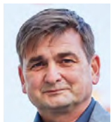
Martin Červíček, hejtmán Královéhradeckého kraje

Pro náš region je klíčové, aby dopravní infrastruktura byla nejen modernizována, ale aby byla i dobudována. Prodloužení dálnice D11 do Jaroměře je pro kraj bezesporu velmi významnou stavbou. Dálnice velmi prospěje řidičům, kteří jezdí mezi Hradcem a Náchodem či Trutnovskem a uleví silnicím 1. třídy i dalším silnicím, které patří pod správu kraje. Všichni si od toho slibujeme zlepšení bezpečnosti i plynulosti dopravy. Teď budeme dál netrpělivě vyhlížet to, až se podaří dálnici dokončit až ke státním hranicím s Polskem. Kromě D11 mě těší posun i u dalších dopravních staveb v regionu, jako je třeba D35 mezi Hradcem a Jičínem. Minimálně úsek okolo Hořic už je opravdu na spadnutí.