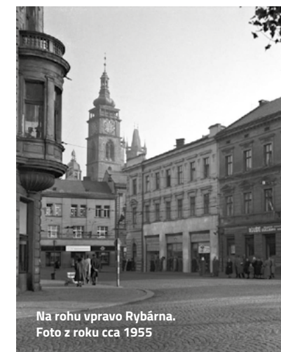
Na rohu vpravo Rybárna. Foto z roku cca 1955

elegantně oblečen a byl to velice společenský člověk, který šéfoval celému východočeskému kraji. K Potravinám tehdy patřila i denní vinárna Lipka na Velkém náměstí. Ředitelství Potravin sídlilo tehdy v ulici Čsl. armády, vedle hotelu Bystrica, a tak to měl pan ředitel kousek od Jadranu, kde se i dosti často objevoval a rád sem chodil na „kontroly“. Jadran byl velice oblíbený bufet s rybami v Hradci Králové, kam se též chodilo na jídlo a něco dobrého a kvalitního popít, a protože ředitelství v Hradci Králové se o tento podnik vzorně staralo, dlouhá léta úspěšně prosperovalo. Rybárna Jadran stála v Mostecké ulici přímo naproti dnešnímu samoobslužnému obchodu Erko. Byl tam takový