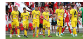
FC HRADEC KRÁLOVÉ str. 10 ▶ 13