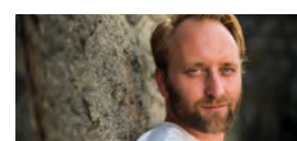
PAVEL KHEK str. 30 ▶ 34

Vydavatel: TN Média s. r. o., Branická 213/53, 147 00 Praha 4, IČO: 28847229, MK ČR E 23744, Sídlo redakce: Velké náměstí 21/31 500 03 Hradec Králové, www.salonkyhk.cz, Redakce: Tomáš Kulhánek, tel.: 739 513 184, e-mail: tomas.kulhanek@salonkyhk.cz, Michal Bogán, tel.: 734 545 423, e-mail: michal@salonkyhk.cz, Hynek Šnajdar, tel.: 734 457 697, e-mail: hynek@salonkyhk.cz, Obchod, inzerce: Monika Klikarová, e-mail: monika@tn-media.cz, tel.: 733 353 695, Grafika: Michal Krieglér, Jazyková korektura: Hedvika Landová, Distribuce: vybraná distribuční místa, Tisk: Tiskárna PRATR a. s., Náchodská 524, Trutnov, Sazba: TN Média s. r. o., Číslo ISSN: ISSN 2694-7757, Četnost: měsíčník, Počet výtisků: 8 000, Regionální mutace: Královéhradecko, Titulní strana: Ondřej Littera.