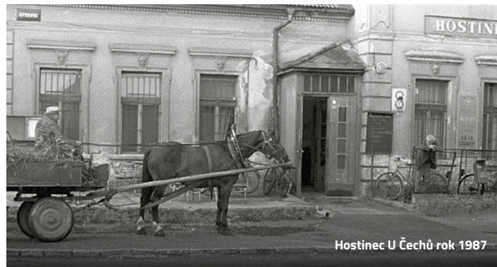
Hostinec U Čechů rok 1987

Hostinec Pod viaduktem – tato hospoda se otvírala ve všední dny v 9,00 a měla otevřeno do 18,00 hod. (sobota, neděle zavřeno) a už od rána tam přicházeli hlavně dělníci z různých okolních podniků na svačinu a později na obědy. Tato hospoda patřila Jednotě v Novém Bydžově a pracovali tam v letech 1973 až 1978 manželé Miloslav a Žofie Trávníčkoví ke spokojenosti všech hostů, kteří tam pravidelně chodili. Hospoda měla stoly a židle ve staročeském stylu a hosté se tu velice dobře cítili. Už před 9. hodinou tam každý den stála fronta hladových a žiznivých pravidelných hostů. Výborně se tam vařilo a každý den kuchařka paní Žofie Trávníčková vařila kolem 150 obědů. Nejvíce na odbyt šla vždy dršťková a gulášová polévka a další tradiční česká oblíbená jídla, která se již v dnešních nových a moderních restauracích už tolik nevidí. V dopoledních hodinách zde bylo neustále plno a většinou si nebylo v tomto čase ani kam sednout. Pořádaly se zde i různé akce, jako např. svatby, vepřové hody, podnikové večírky atd. Tuto hospůdku si také v té době velice oblíbili i lékaři a sestřičky z fakultní nemocnice, kteří zde pořádali setkání a vždy se tam po několik let náramně bavili a velice rádi vždy po roce se sem vraceli. Chodili se tam také bavit zaměstnanci hradeckého DEPA a právě v roce 1978 dostali manželé Trávníčkoví lákavou nabídku od vedení tohoto podniku, jestli by nešli pracovat do Janských Lázní na je-