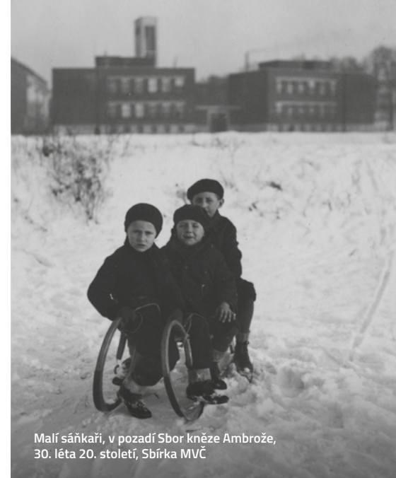
Malí sánkaři, v pozadí Sbor kněze Ambrože, 30. léta 20. století