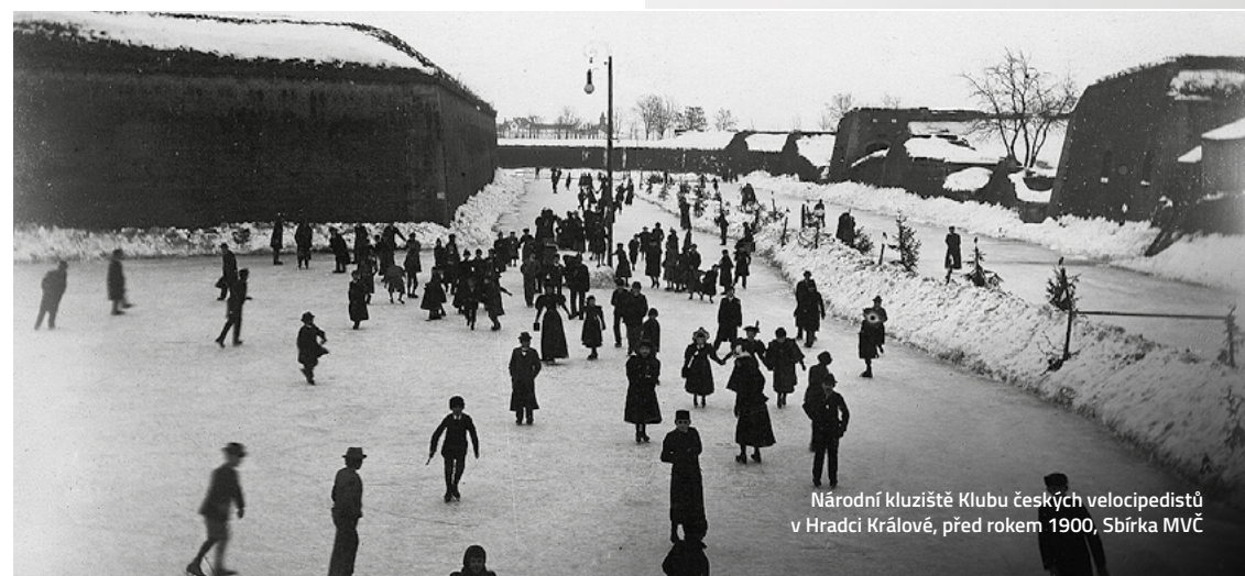
Národní kluziště Klubu českých velocipedistů v Hradci Králové, před rokem 1900