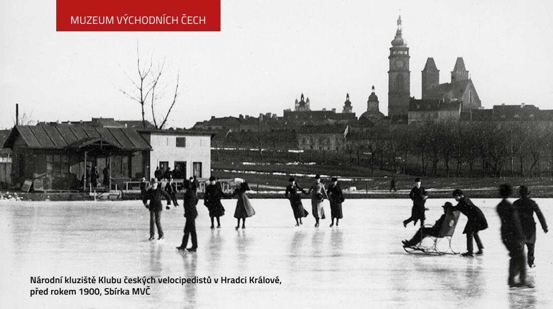
Národní kluziště Klubu českých velocipedistů v Hradci Králové, před rokem 1900