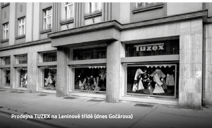
Prodejna TUZEX na Leninové třídě (dnes Gočárova)