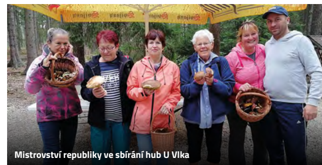
Mistrovství republiky ve sbírání hub U Vlka

Na kole si můžete zajet i na Stříbrňák, kde na vás čekají tři občerstvovací stanice, z nichž neznámější je hospůdka U Koziček. Zde mají velký sortiment nápojů a jídel a můžete zde