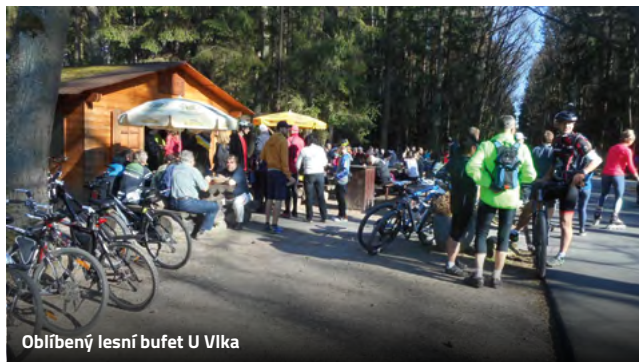
Oblíbený lesní bufet U Vlka

A můžeme pokračovat – hned na kraji lesa stojí historická budova Zděná Bouda, kde se můžete ubytovat, přijít na oběd či večeři nebo zajistit místnost pro různá setkání nebo svatby. Součástí Zděné Boudy je i venkovní bufet, kde je možnost se občerstvit